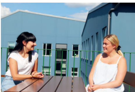
Nya möjligheter i Nya Sylteskolan. Sidorna 12-13