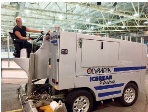
Mathilda basar över ismaskinen i Slättbergshallen. Sidan 10.