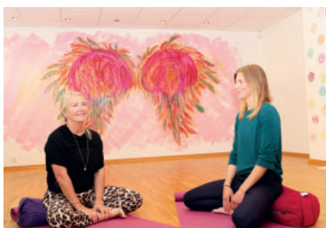
Yogafilmer för medarbetare. Sidan 16.